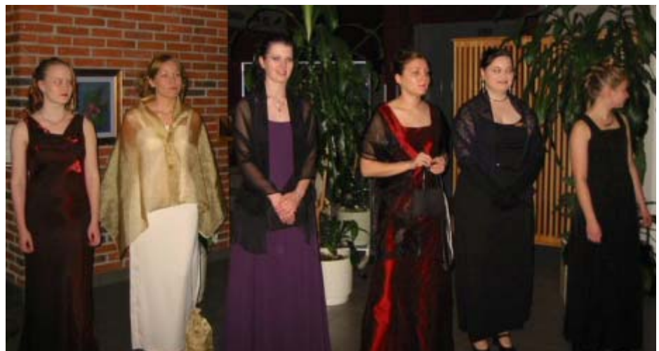
Hallituksen tytöt kauniina juhlapuvuissansa