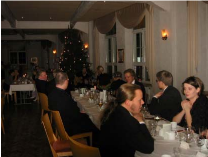
Juhlavieraita keskustelemassa henkevästi. Taustalla flamenco-yhtye Bajo Cero